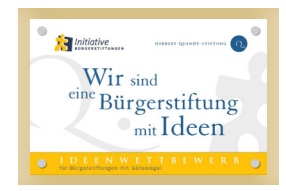
Auszeichnung von der Herbert-Quandt-Stiftung