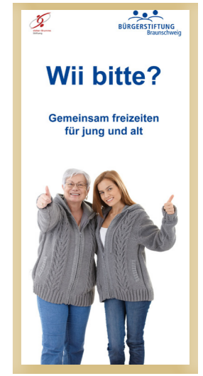
Wii bitte? Machen Sie mit und freizeiten Sie gemeinsam mit anderen.