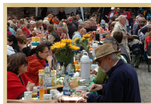
29.5.: 4. Braunschweiger Bürger-Brunch