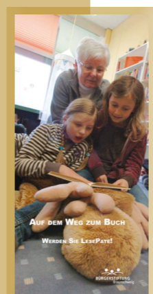
Auf dem Weg zum Buch - Der Dauerbrenner seit 2004