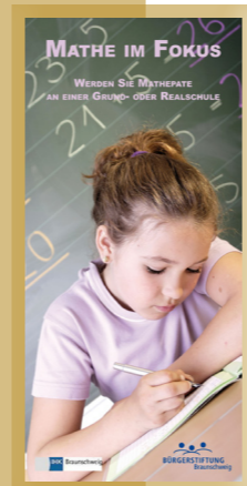
Mathe im Fokus - MathePaten fordern seit dem Schuljahr 2011/2012 Schülerinnen und Schüler an Grund- und Realschulen