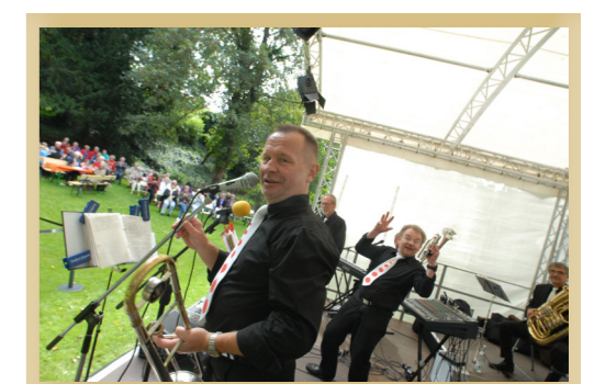
28.8.: 2. Benefiz-Jazzfrühschoppen