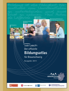
Januar: Erster offizieller Bildungsatlas für Braunschweig