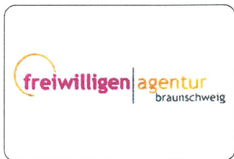
Das neue Logo der FreiwilligenAgentur

Wer eine ehrenamtliche Aufgabe sucht und wer ehrenamtliche Hilfe für ein gemeinnütziges Projekt benötigt, der ist bei der Freiwilligen-